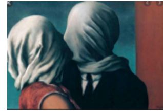
Les amants René Magritte 1898 / 1967