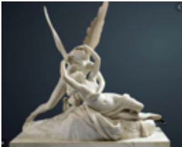
Psyché ranimée par le baiser de L'Amour Antonio Canova 1757/1822

Faire découvrir quelques représentations de l'amour dans l'Art : les étudier et les commenter.