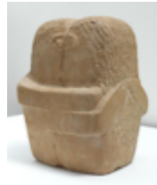
Le Baiser Constantin Brancusi 1876/1957